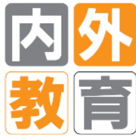
（紙媒体版内外教育ロゴ）

教育を「新しい視点」から見るサイトであることをイメージし、紙媒体版内外教育ロゴの4つの四角を正面以外の視点から見たサービスアイコンを作成しました。